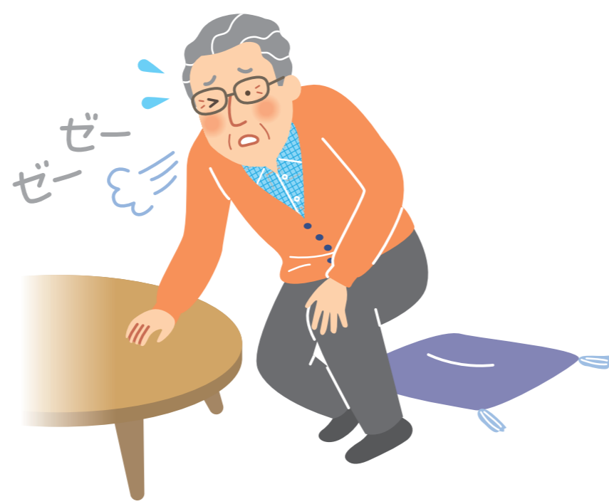
立ち上がるとき 息があがってしまう