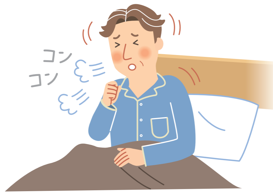
夜、咳で目が覚める 朝、起きると咳が出る