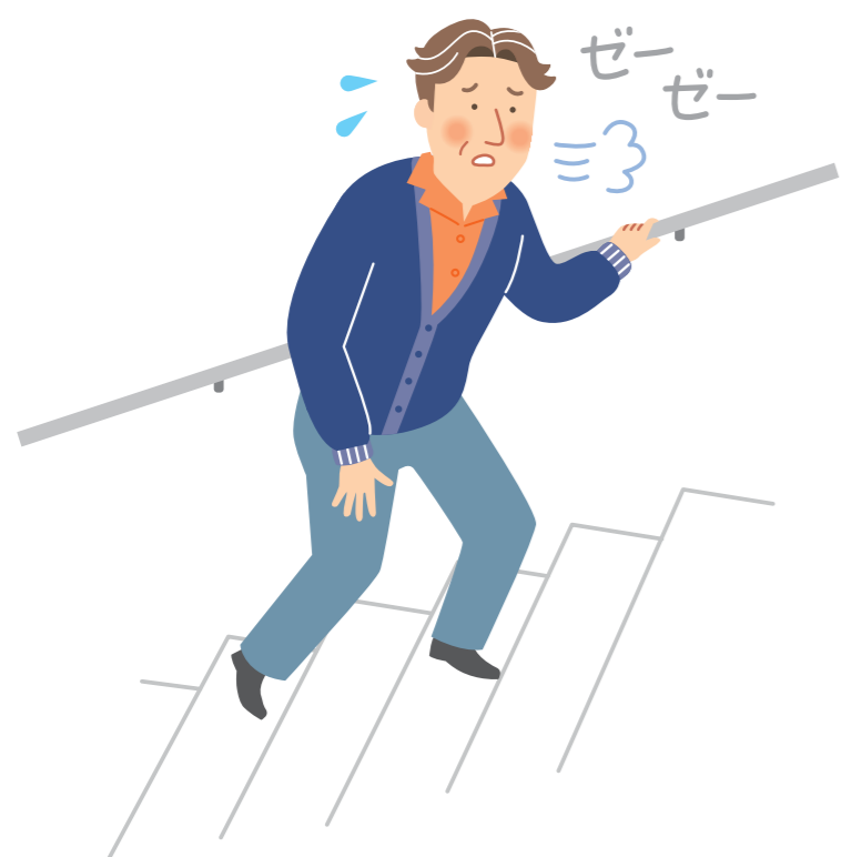
咳や息切れのせいで 立ち止まることがある

間質性肺疾患では長い期間にわたって、このような症状があらわれたりします 1) 。