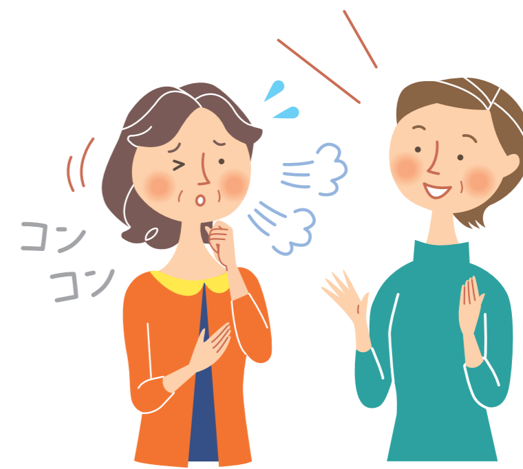
人と話すとき 咳が出て困ることがある