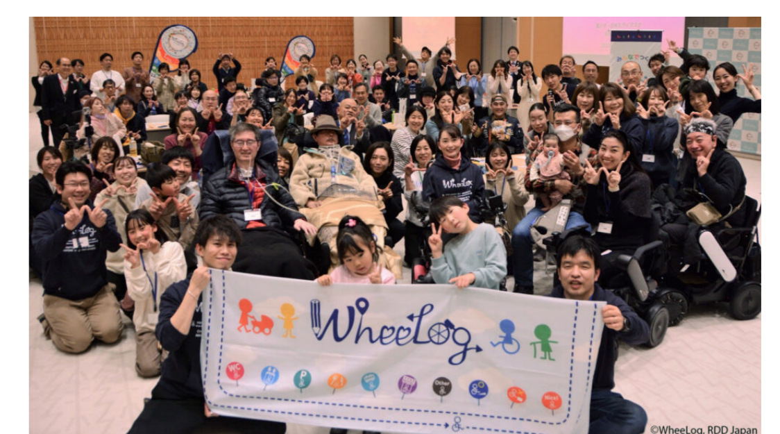
東京日本橋 そぞろ歩き

2/28 RDD Tokyoでは分身ロボットカフェにてRDDイベントと公式YouTubeチャンネルでのLIVE配信を実施しました。東京タワーでのパネル/作品展示も行い、イベント、オンライン、展示のハイブリッド開催となりました。また、世界規模で広がりを見せている「Global Chain of Lights」活動に今年も参画し、東京タワーをRDDカラーにライトアップしました。