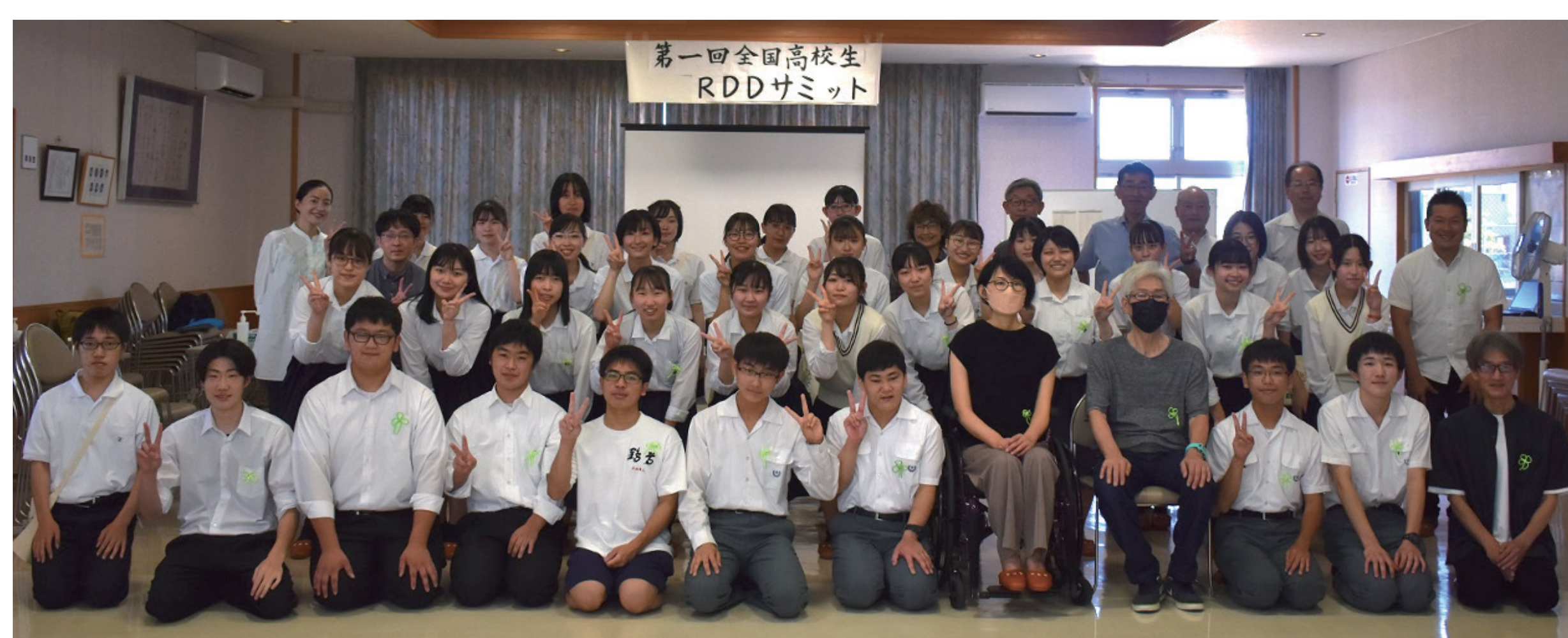
現地参加者の集合写真