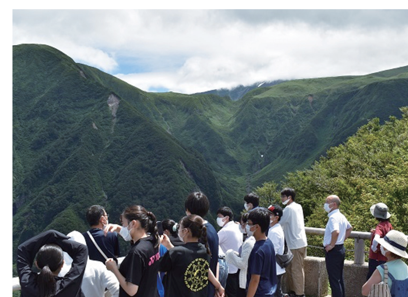
酒田市の自然をめぐる学習

2023年3月には、第2回全国高校生RDDサミットが開催されます。 これからも高校生たちのRDD活動の応援をお願いします!